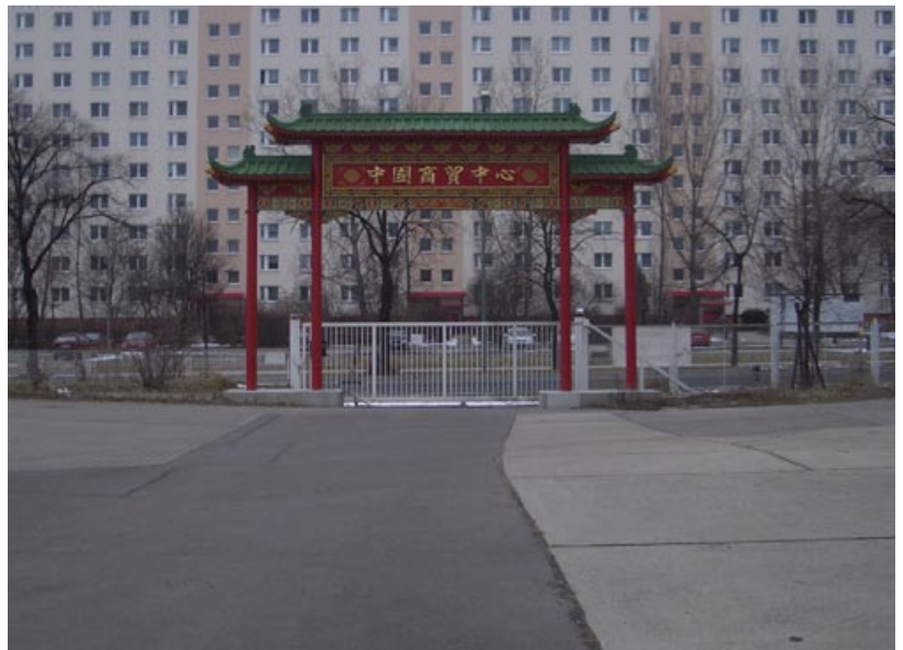
Einfahrt zum chinesischen Großmarkt in Berlin Lichtenberg

Die Bewegung der Menschen im Raum, die Migration, ist auch eine Bewegung der Räume. In Berlin sind viele solcher „migrierten Räume“ zu beobachten, Berlin selbst ist kein statischer Raum, sondern stellt eine Vielzahl von sich verändernden Räumen dar. Diese zahlreichen Bewegungen und Veränderungen haben sich seit dem Mauerfall beschleunigt.