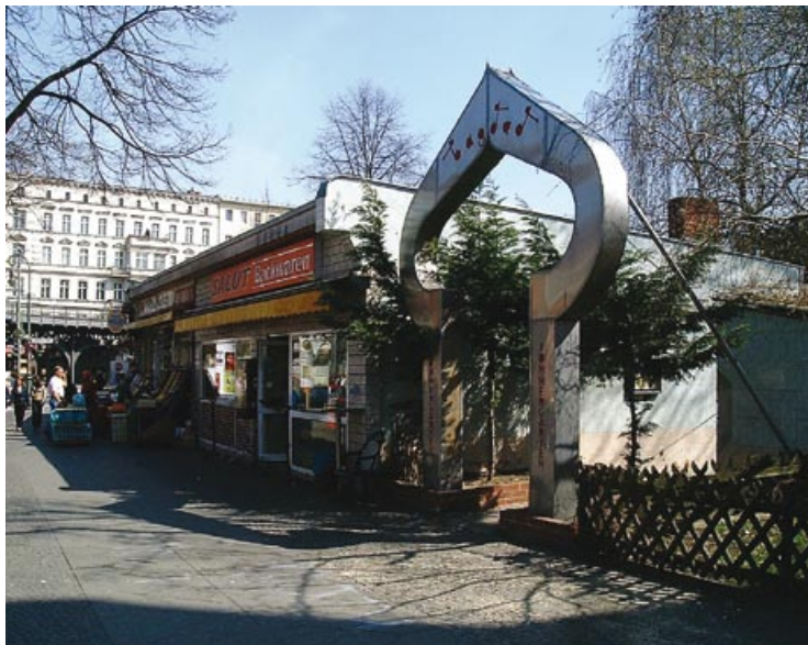
Restaurant Bagdad am Schlesischen Tor in Berlin Kreuzberg

Die Betrachtungsschwerpunkte bilden die durch Migration entstandenen Raumphänomene und die Wahrnehmung von Stadt aus Migrantensicht